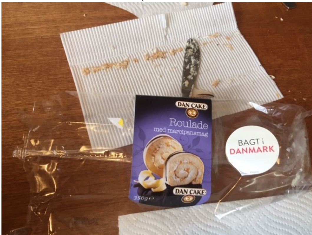
Formiddagskaffen med roulade er overstået :-)