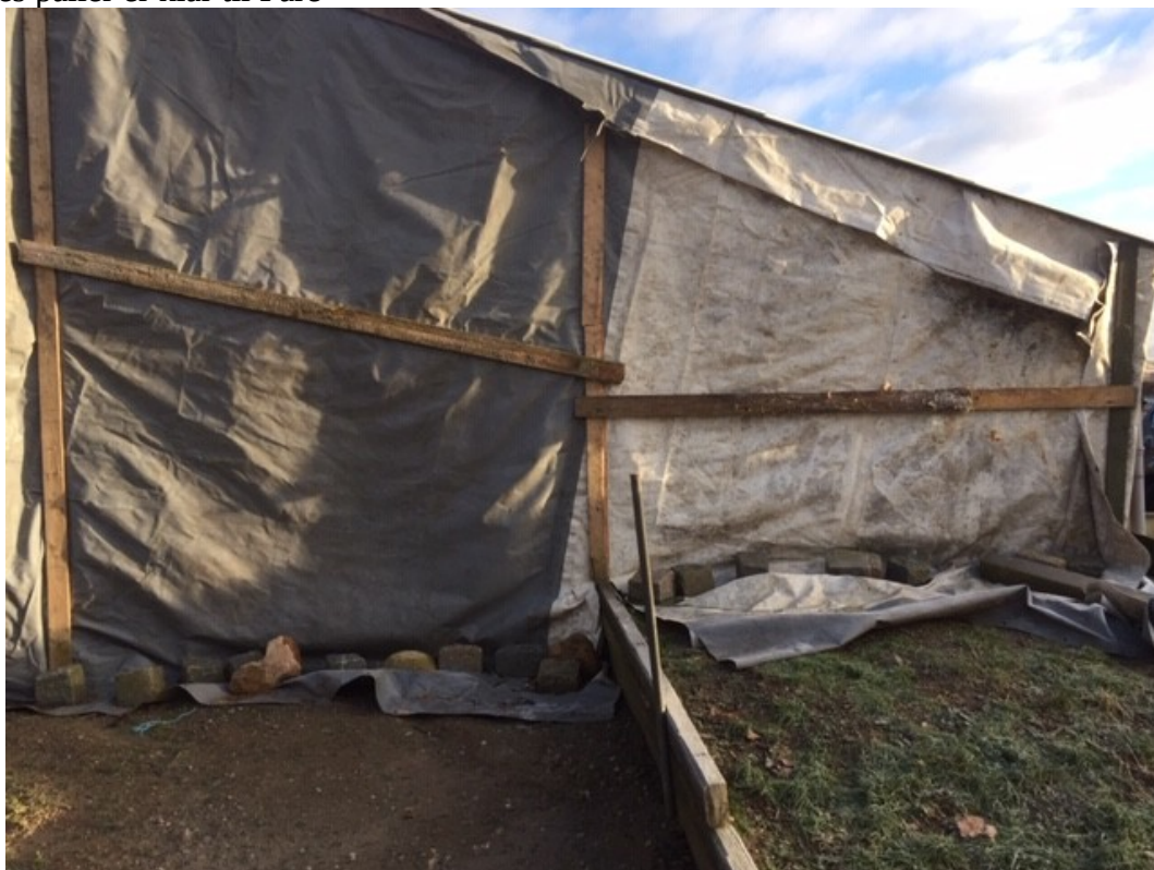
Ikke så kønt, men vi håber det virker mht til støj fra presenningerne. Der er også monteret brædder på indersiden.