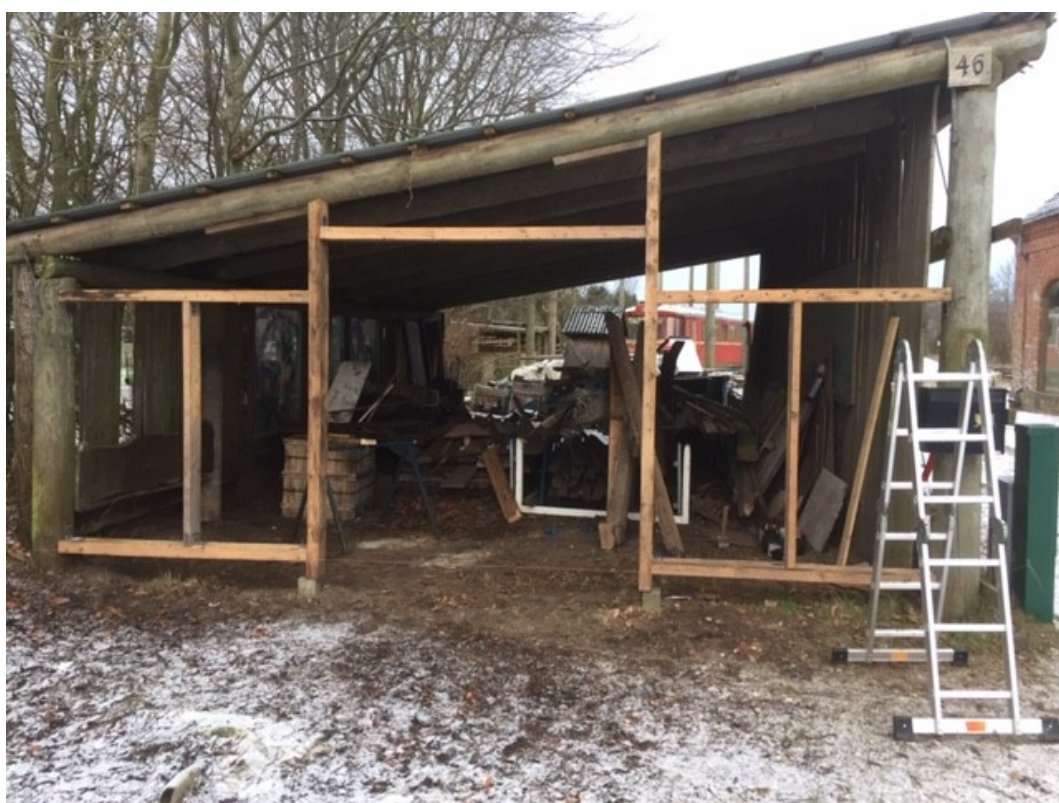
Der mangler en lodret stolpe i højre del, men ellers er det resultatet af tømrearbejdet