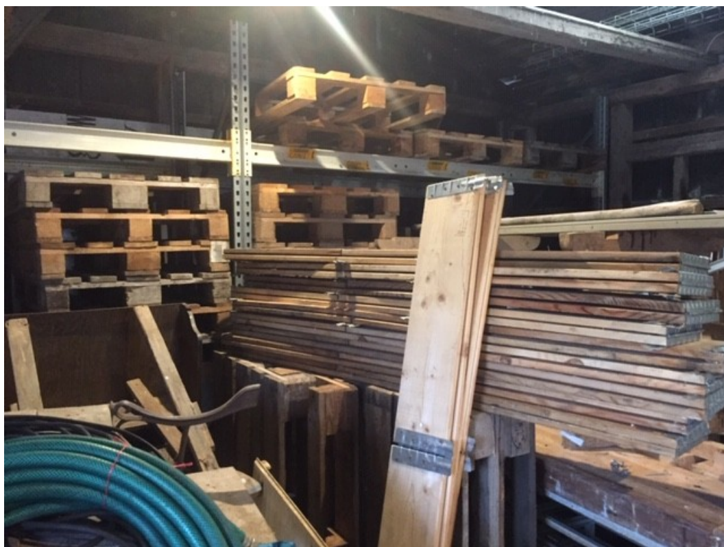
Paller og rammer er stablet ind i æ Røe hal