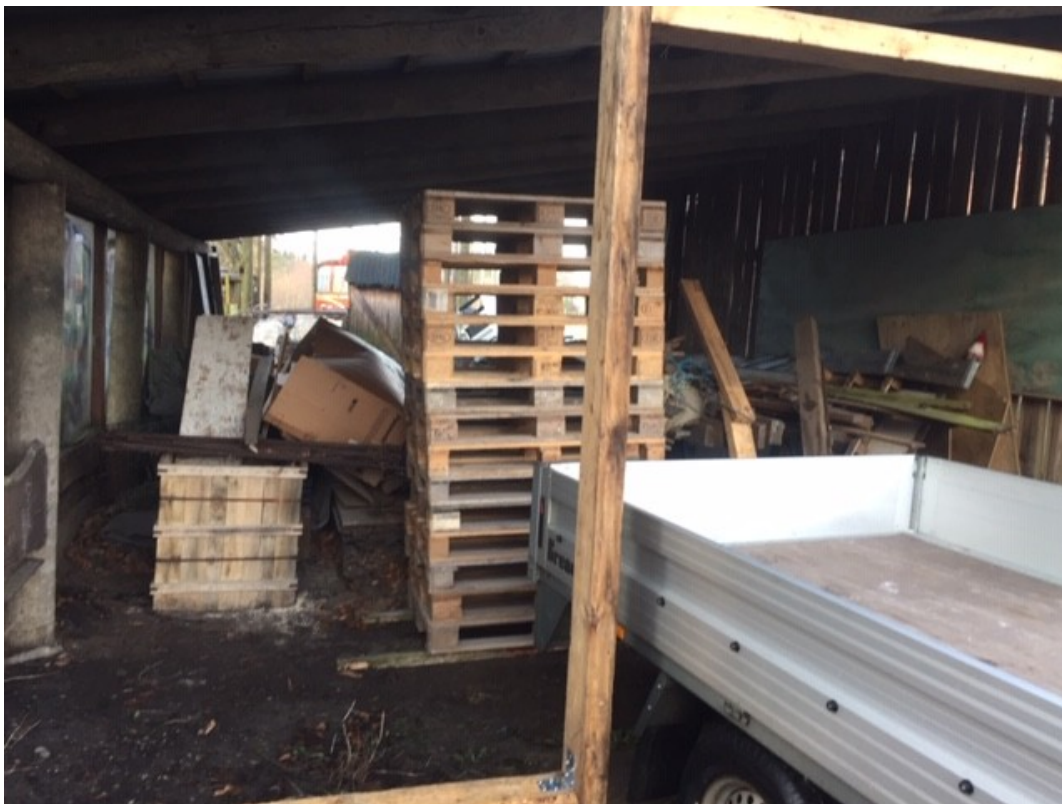
En pæn stak paller