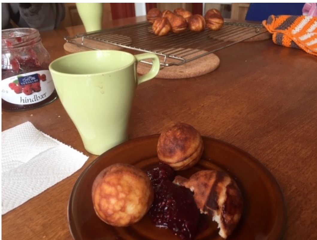
Middagsmaden er serveret