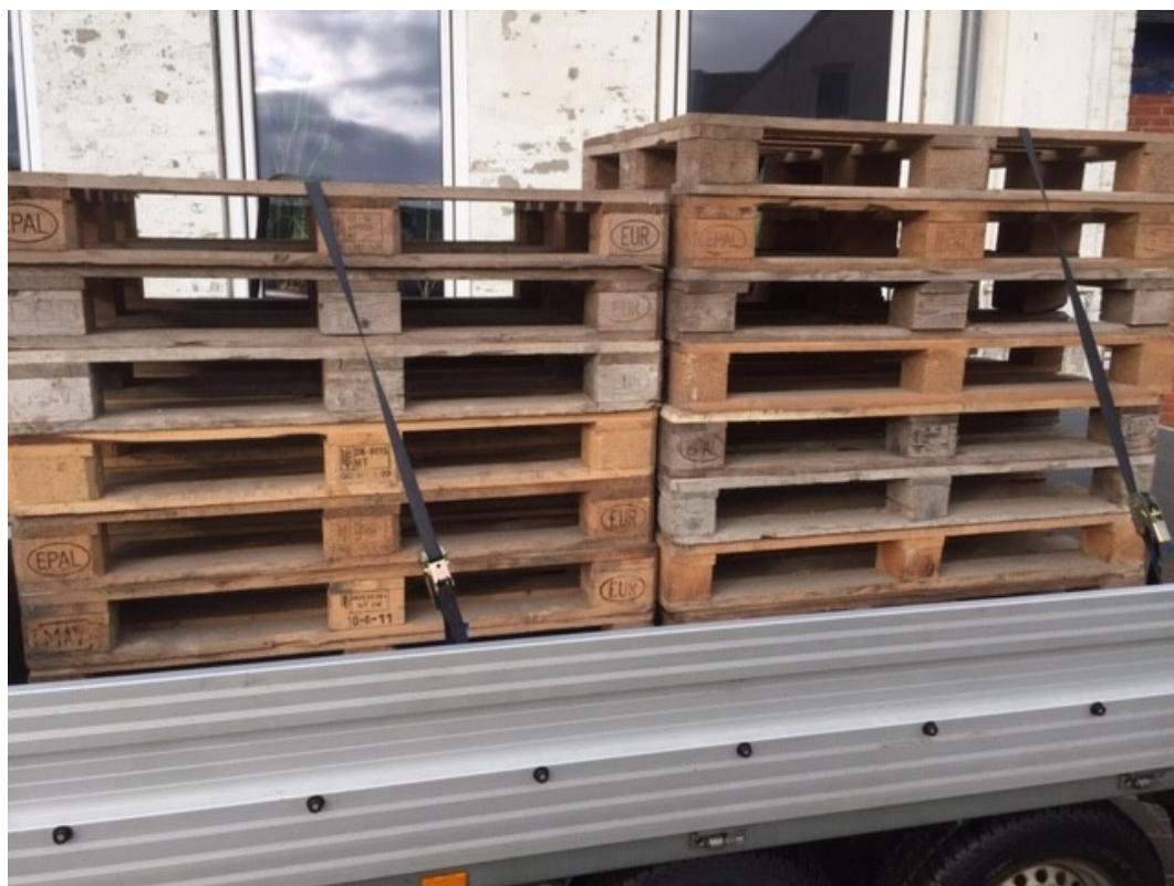
Første portion paller inden afgang til Fåre