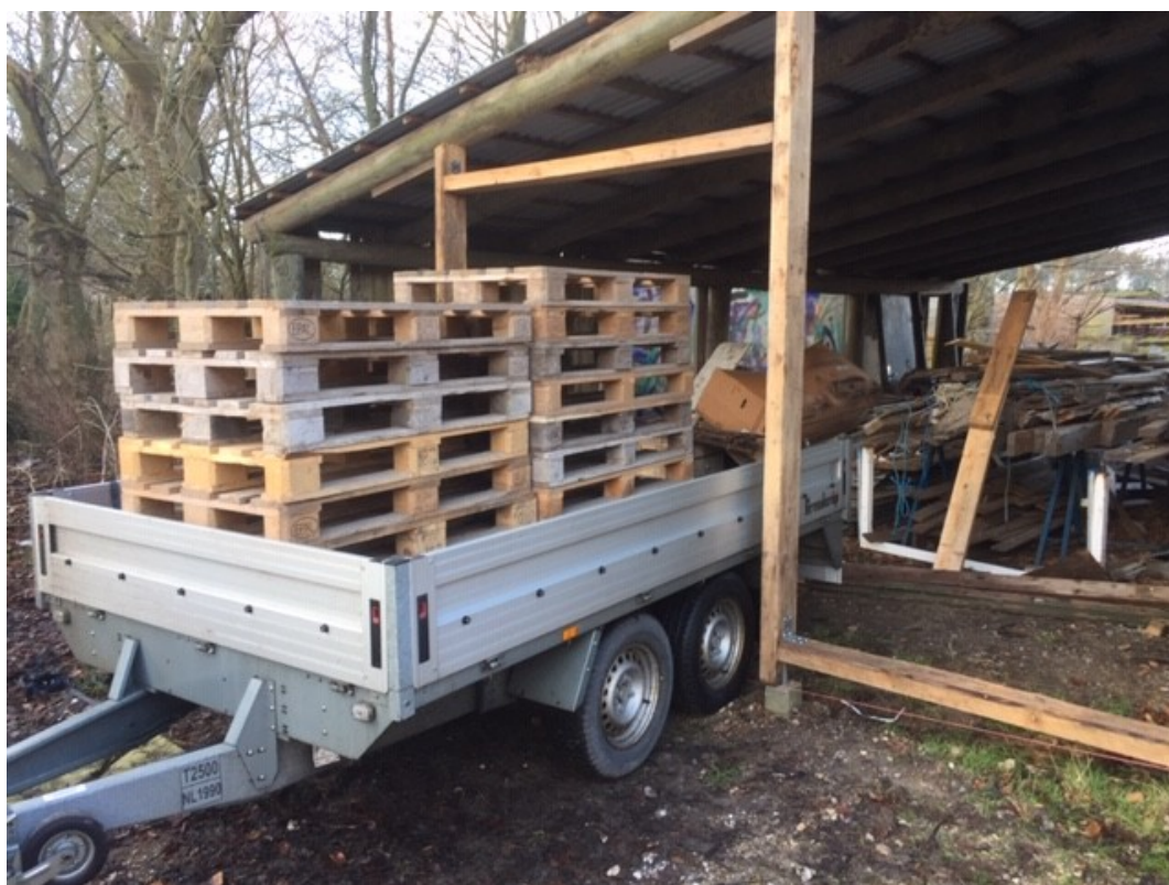
Jow, jow. Porthullet passer skam fint til traileren