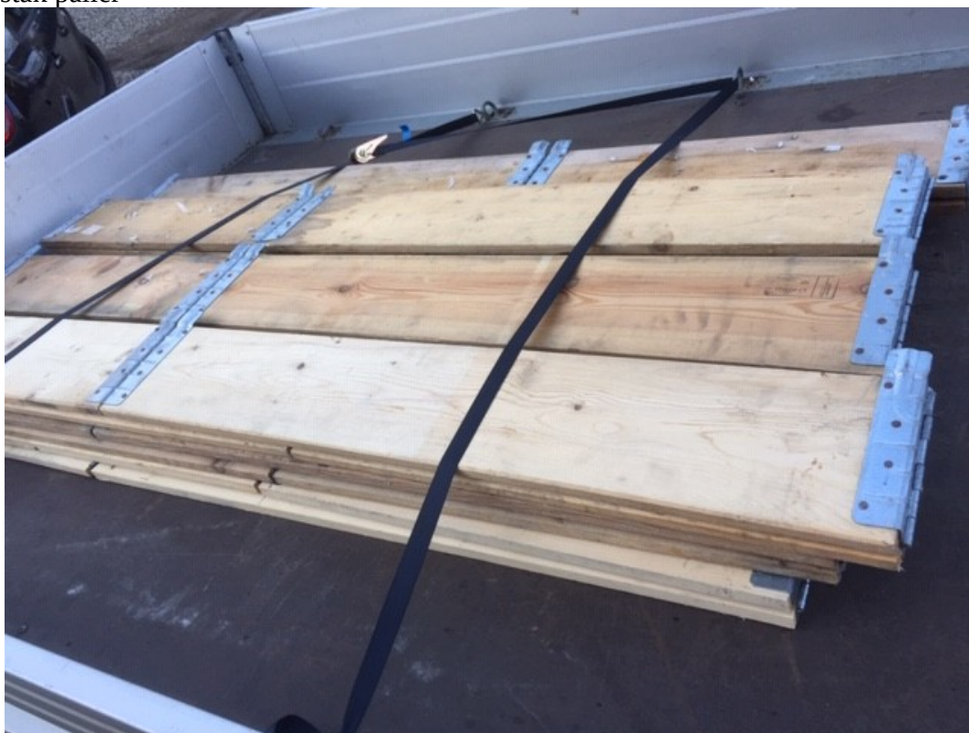
Pallerammer klar til hjemkørsel