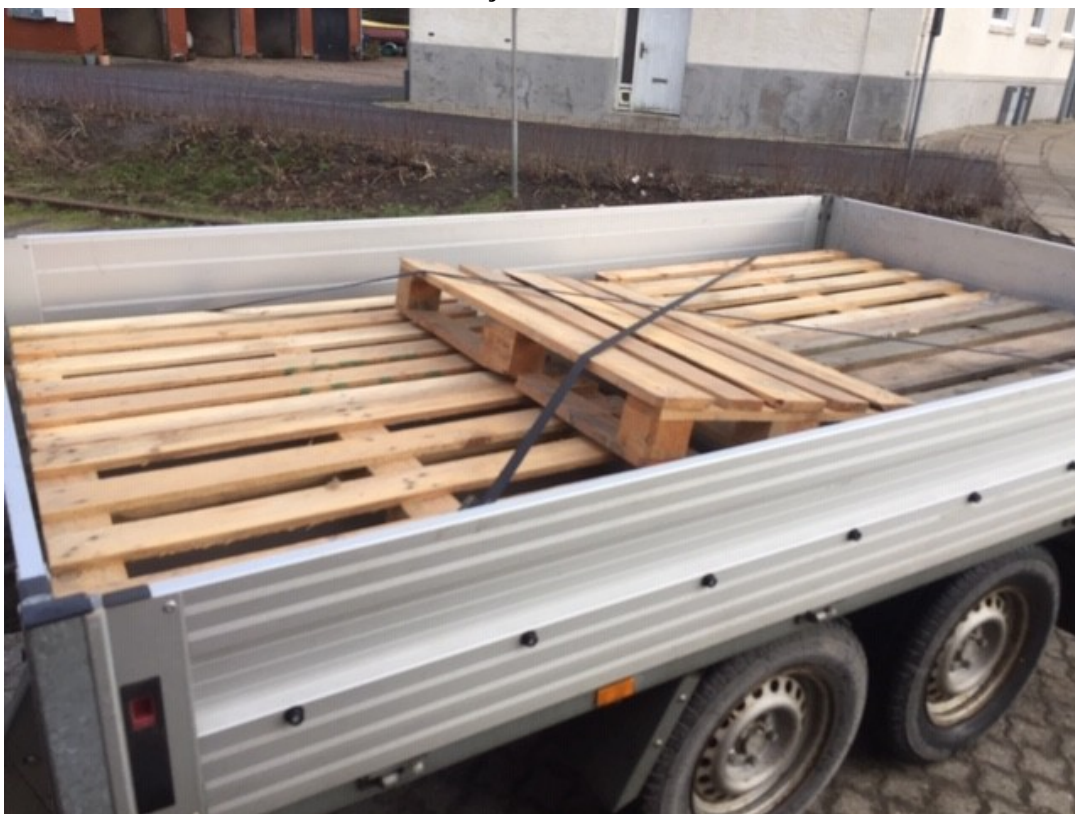
Næste læs paller er klar til Fåre